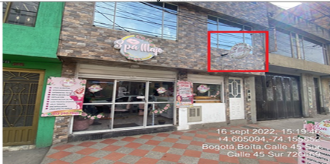
Fotografía No. 4

En la cual se evidencia un (1) elemento PEV perteneciente al establecimiento comercial SPA MAJO , el cual se encuentra volado de la fachada y es adicional al único elemento permitido por fachada de establecimiento.