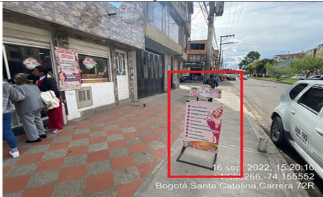
Fotografía No. 3

En la cual se evidencia un (1) elemento no regulado perteneciente al establecimiento comercial SPA MAJO , el cual se encuentra ubicado en área de espacio público.