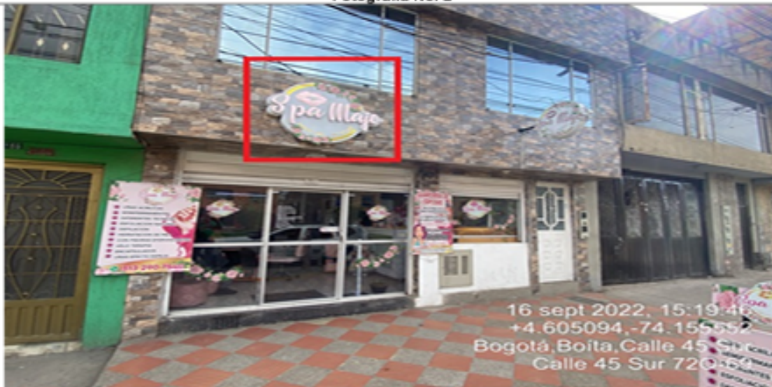
Fotografía No. 2

En la cual se evidencia un (1) elemento tipo aviso en fachada ubicado en antepecho de segundo piso, perteneciente al establecimiento comercial SPA MAJO, el cual al momento de la visita se encontraba instalado sin el registro ante la SDA.