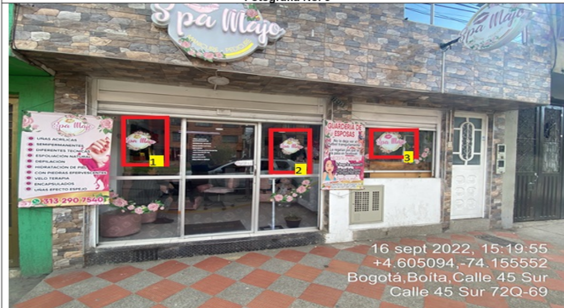
Fotografía No. 5

En la cual se evidencian tres (3) elementos PEV pertenecientes al establecimiento comercial SPA MAJO, los cuales se encuentran incorporados en las ventanas de la edificación.