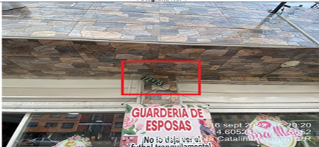
Fotografía No. 1

En la cual se evidencia la nomenclatura urbana donde se ubica el establecimiento comercial SPA MAJO, en la CL 45 sur No. 72 Q - 75 de la localidad de los Kennedy.