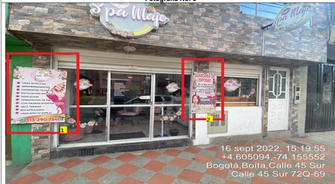
Fotografía No. 6

En la cual se evidencian dos (2) elementos PEV pertenecientes al establecimiento comercial SPA MAJO, los cuales son adicionales al único elemento permitido por fachada de establecimiento comercial.